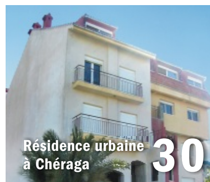
Résidence urbaine à Chéraga