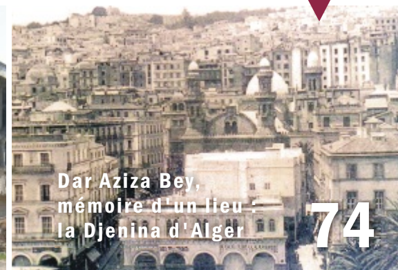
Dar Aziza Bey, mémoire d'un lieu - la Djenina d'Alger