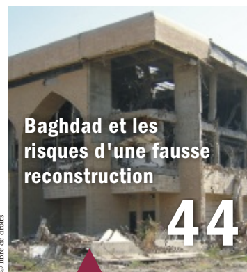
Baghdad et les risques d'une fausse reconstruction