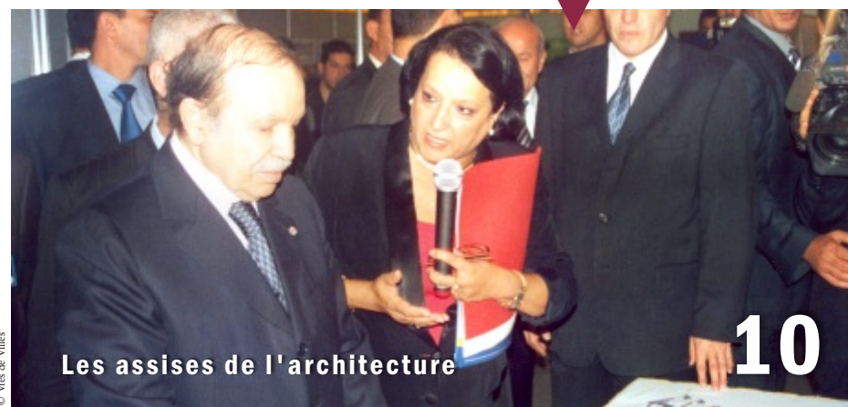
Les assises de l'architecture