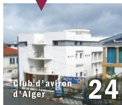
Club d'aviron d'Alger