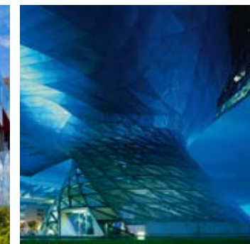
_ 92 Production