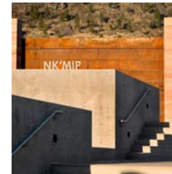
_ 46 Tourisme