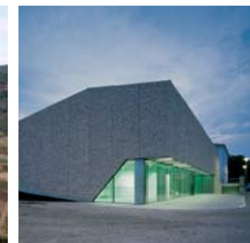
_ 110 Sport