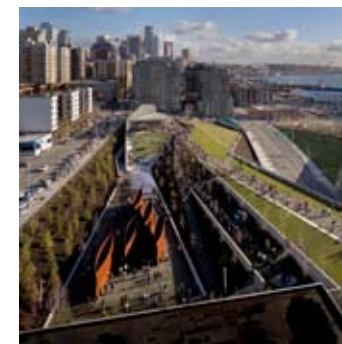
_ 82 Nature