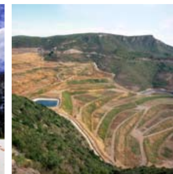
_ 106 Énergie, déchets & recyclage