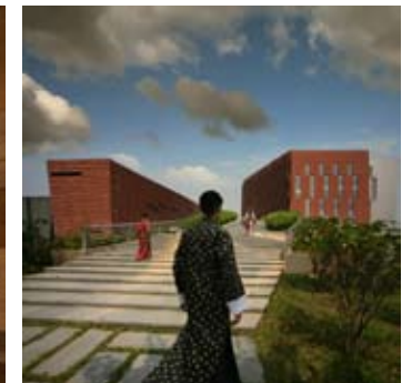
_ 54 Bâtiments publics