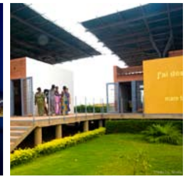
_ 42 Santé