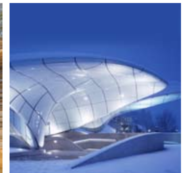
_ 74 Transport