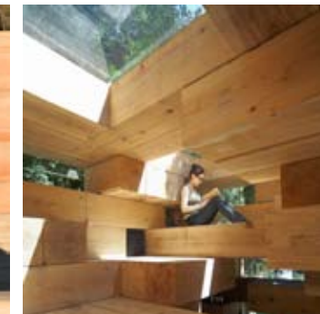
_ 50 Maisons individuelles