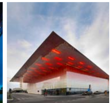
_ 98 Shopping