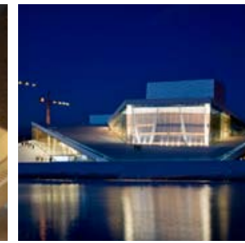
_ 36 Culture