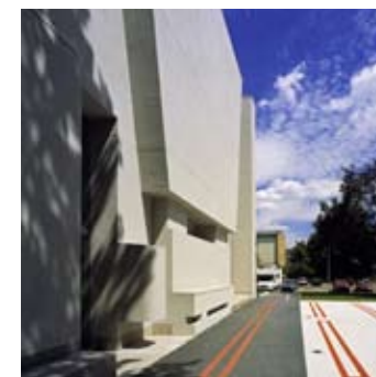
_ 102 Religion & Contemplation