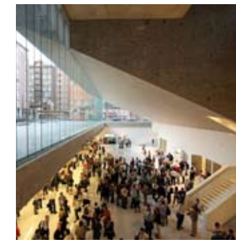
_ 30 Éducation