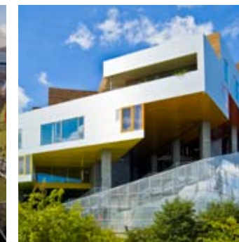
_ 88 Habitat