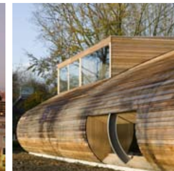
_ 70 Design & loisirs