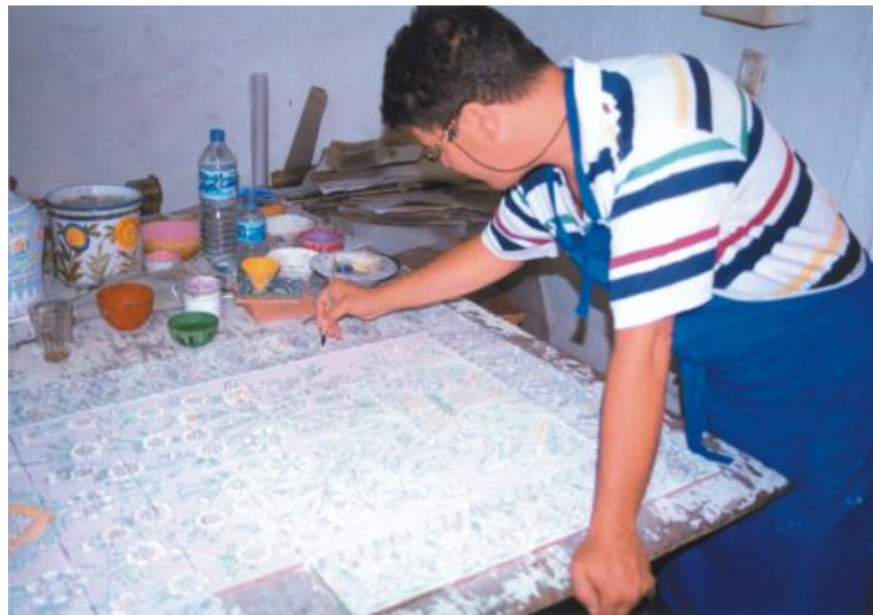
Reportage réalisé par Nahla RIF

C arreaux de céramiques, panneaux muraux, miniatures persanes,... Mohamed Boume hdi, doyen des céramistes algériens n'est plus à présenter.