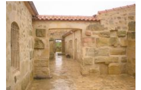
Site de Madaure après restauration

Pour ces quatre sites antiques, la stratégie de mise en valeur a préconisé des interventions sur plusieurs niveaux. Leur caractère rural les prédispose à devenir des Parc Culturels, en accord avec la loi sur le patrimoine, et de les doter d'un plan de