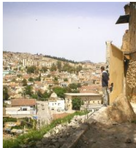
Vue de la ville à partir du site de St Augustin

Le travail d'aménagement s'est basé sur la topographie du terrain et les structures existantes, par le biais d'un traitement exclusivement minéral, en pierres locales. Cette intervention discrète a pour objet l'effacement au bénéfice de l'olivier. Pour améliorer la progression vers l'éminence sur laquelle est juché l'olivier, un aménagement de rampes et d'escaliers a été proposé. Les pèlerins accomplissent ainsi une ascension graduelle vers cet olivier au tronc noueux, au branchage touffu et à l'ombrage généreux.