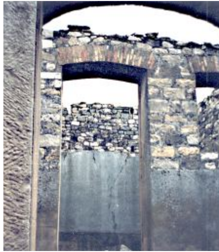
Site de Madaure avant restauration