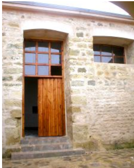
Site de Madaure après restauration