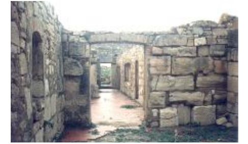
Site de Madaure avant restauration

du parcours de St Augustin. En effet, le tourisme culturel peut être un véritable levier économique majeur pour la wilaya. Par ailleurs, l'orientation de ce projet en direction de la population, grâce à la démarche de la conservation intégrée, qui est considérée comme le moyen le plus viable qui puisse permettre à ces sites d'assurer leur rôle social et culturel, tend à impliquer les acteurs locaux, et à assurer la survie de ces sites, en